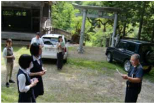
「神社や祭り」大塩富士浅間神社の現地調査

5月から始まった「美麻市民科」の授業もテーマごとの現地調査を行いながら、2学期に入り、まとめの段階に入ってきました。