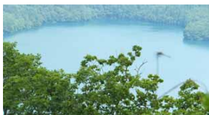
権現山から見た青木湖