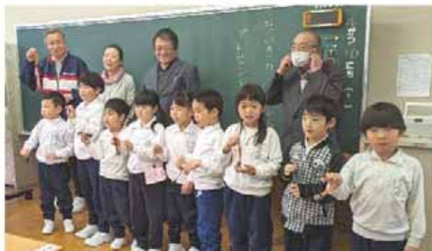
地域の有害鳥獣対策を行っている美麻地区の猟友会と、美麻産の鹿革の有効活用を進めている一般社団法人地域づくり美麻は、新一年生に

安全に登下校してもらう事、有害鳥獣対策について多くの人に知ってもらう事を目的に、美麻産の鹿革をベルトに使った熊鈴を一年生全員にプレゼントしました。