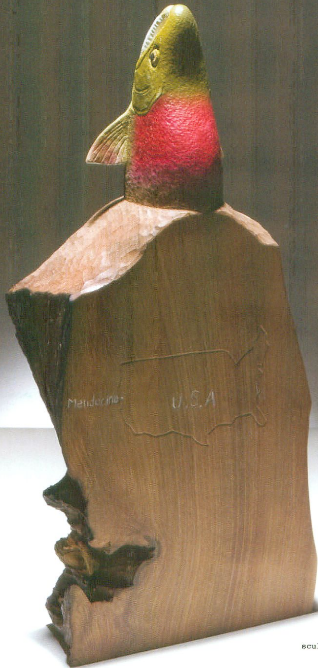
sculpture by Masami Yoshikawa