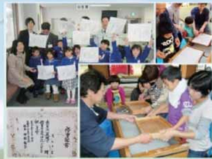
子どもが中心となり地域の伝統文化を継承する活動

美麻地域づくり会議の活動10周年の記念にと、第17回中部の未来創造大賞に応募したところ、地域の皆さんの日々の小さな活動の積み重ねを評価いただき最高賞である『大賞』をいただくことができました。