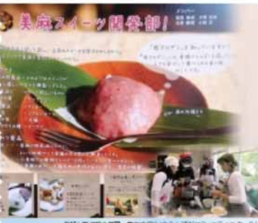
地域と学校が連携し、地域活性化に貢献する活動