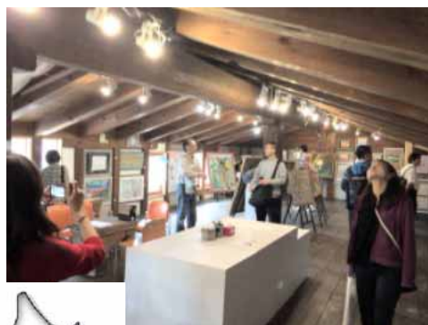
大町では、麻倉等で芸術交流を視察