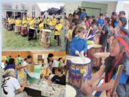
子どもが中心となり地域の伝統文化を継承する活動