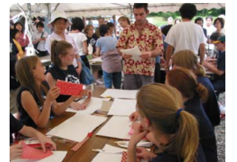
2005年のクラフト体験の様子