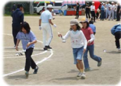
(新種目 逆周リレース)